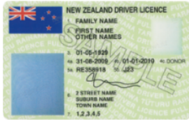
New Zealand driver licence

Use 1 of these ways to confirm your identity