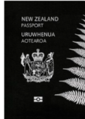
New Zealand passport